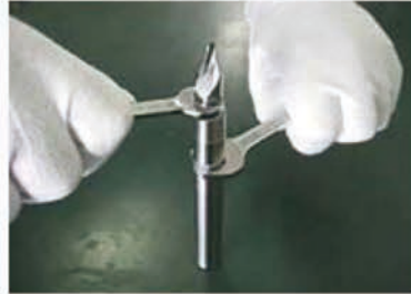
【參考】鎖合的扭力值 (N.m)